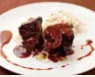
●牛ほほ肉の赤ワイン煮込み

敷居は低く、クオリティは高く。南堀江公園前のゆったりとしたロケーションを前菜に、趣向を凝らしたイタリアン料理を味わえるバーカロ / バカージョ南堀江店。今シーズンのスペシャルメニューは、牛ほほ肉の赤ワイン煮込みリゾット添えです!貴重な