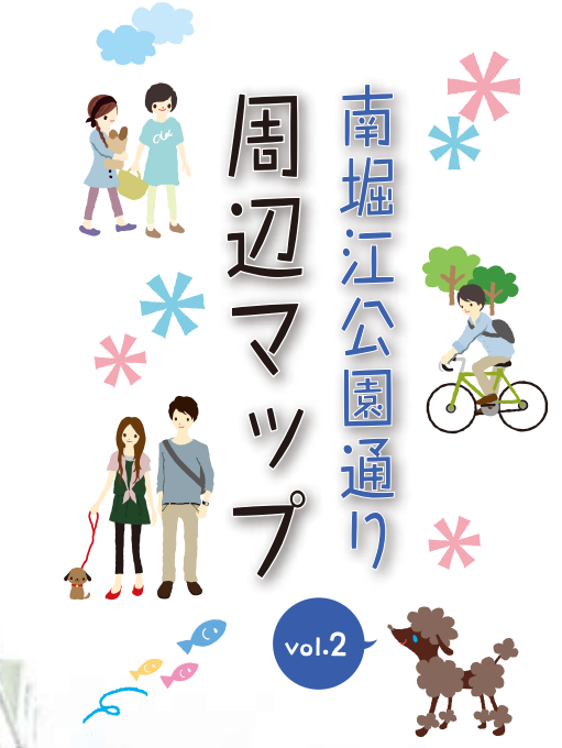
2012 Spring & Summer

■営業時間 11:30~23:00 金土日祝 11:30~24:00 (定休日:不定休)