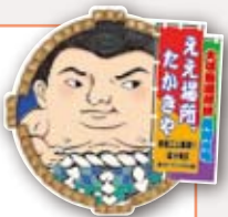
南堀江公園通り・高台地区まちづくりステッカー

梅干しみかんなどがふるまわれ、コスプレお相撲さんとの記念撮影がはじまったり、とてもにぎやかな一日に。スタッフの皆さんお疲れさまでした。そして、いい思い出ごちそうさまでした!