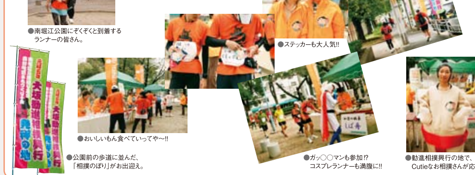
●南堀江公園にぞくぞくと到着するランナーの皆さん。 ●ステッカーも大人気!! ●おいしいもん食べていってや〜!! ●公園前の歩道に並んだ、「相撲のぼり」がお出迎え。 ●ガッツマンも参加!? コスプレランナーも満腹に!! ●勸進相撲興行の地で、Cutieなお相撲さんが応援!!

2011年10月23日「大阪ごちそうマラソン」のコースとなった南堀江公園通り!大坂勸進相撲興行の地らしい威勢の良さで、ランナーの皆さんを迎えました。もてなし会場では、加賀の生姜せんべいや、紀州の